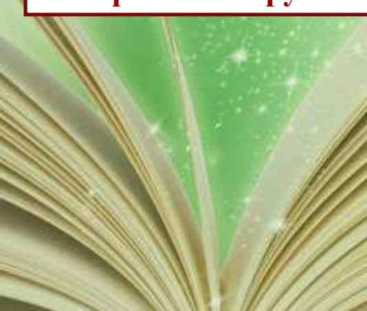
Создание тематического центра «Играем в сказку»