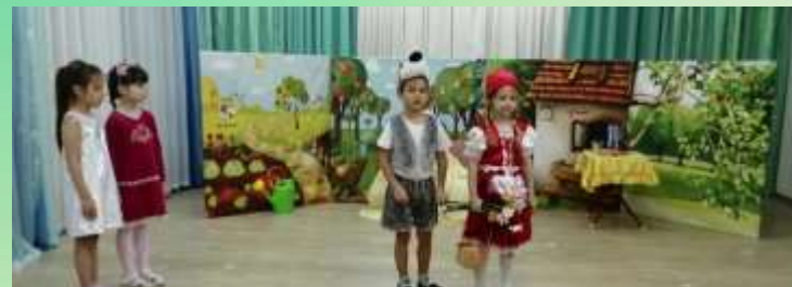
Театрализованная постановка для воспитанников детского сада «Красная шапочка»