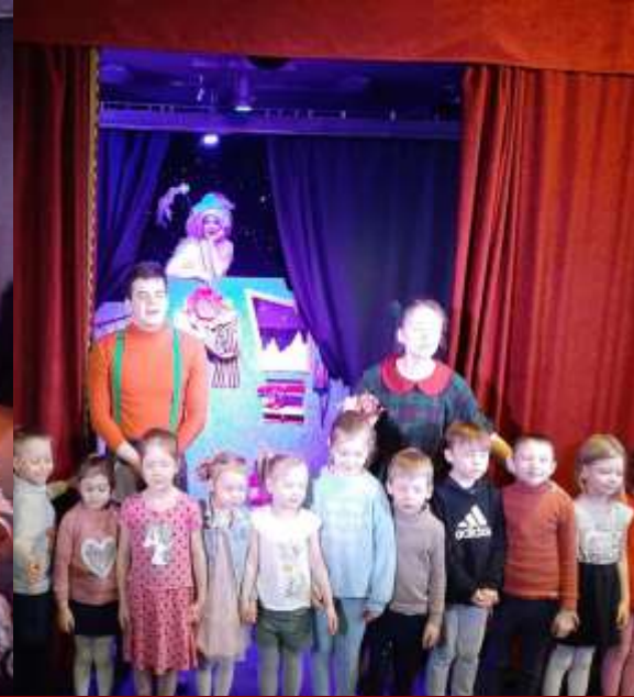
Посещение с родителями театра «Желтый квадрат», спектакль «Мечты сбываются»