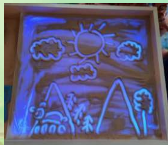
Рисование песком на световом столе «Волшебный мир зарубежных сказок»