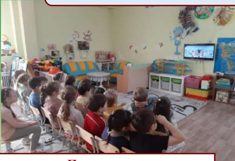
Презентация «Творчество зарубежных писателей»