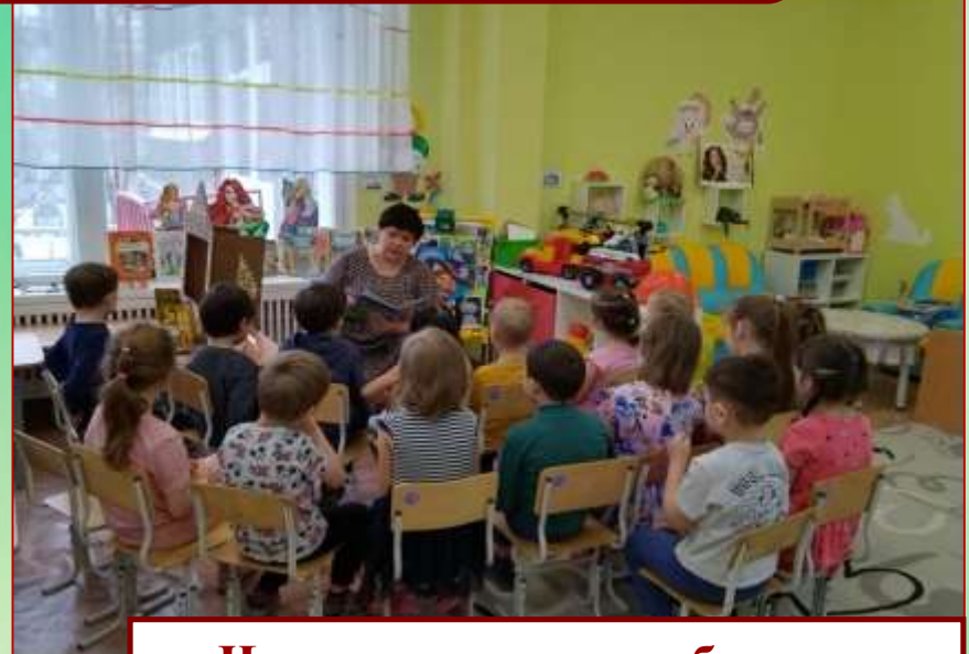
Чтение сказок зарубежных писателей