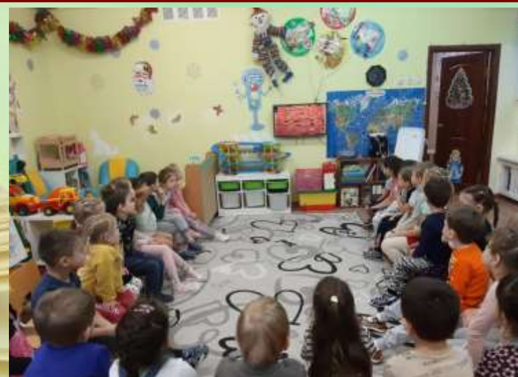
Виртуальная экскурсия в Музей Ганса Христиана Андерсена в датском городе Оденсе