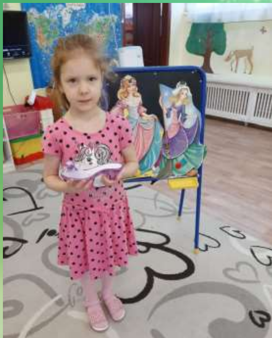
Любимая сказка Маши «Золушка»