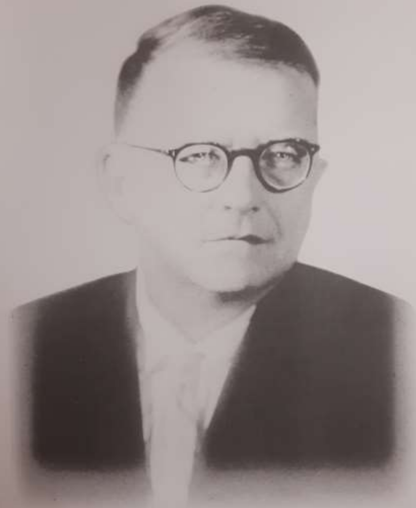
Дмитрий Дмитриевич ШОСТАКОВИЧ 1906 – 1975