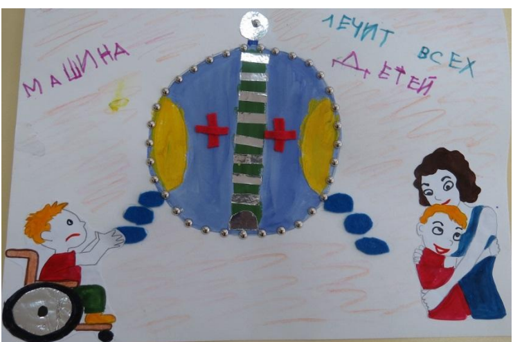
Автор: воспитатель С. И. Залазнюк